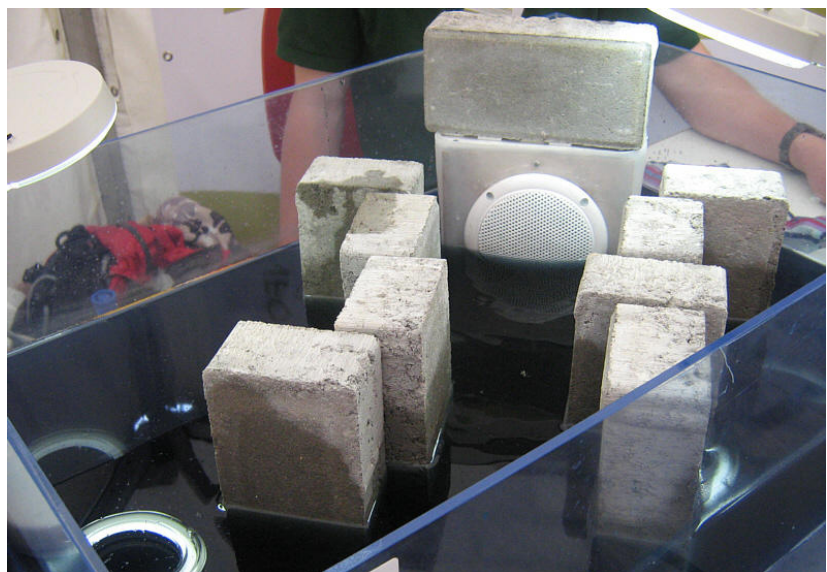
Steine stehen den Schallwellen im Weg.

Von Ada Festag, Selina Mickelat und Kerstin Geist