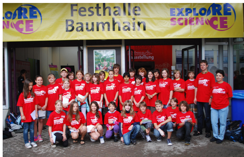
Die Klasse 6a des Carl-Benz-Gymnasiums in Ladenburg.